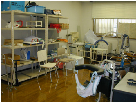
福祉用具室（40種60点を保管）

福祉用具を安全で有効に活用していくためには、個々の身体機能にあわせた用具の選択と適切な使用方法の習得が不可欠となります。湖東リハビリステーションでは、専門的な立場から、福祉用具の導入を支援させていただきます。