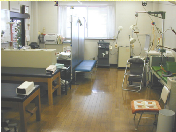
外来リハビリ室 (1階)

病気やケガによる関節障害、日常動作の障がいに対して、生活機能回復のために物理療法や運動療法を行います。