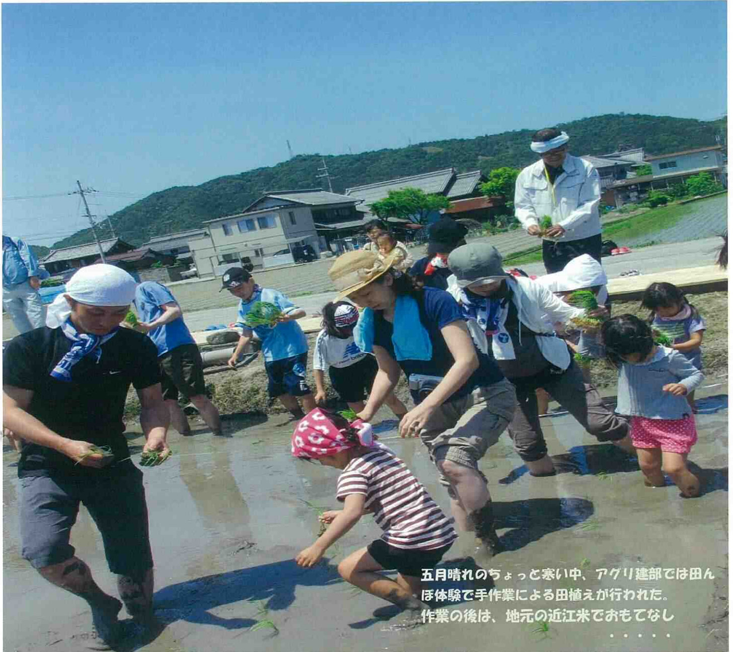
五月晴れのちょっと寒い中、アグリ建部では田んぼ体験で手作業による田植えが行われた。作業の後は、地元の近江米でおもてなし

編集：建部だより編集委員会 発行：建部地区まちづくり協議会・建部コミュニティセンター