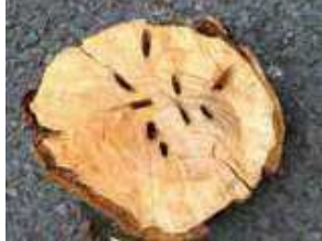
幼虫に食害された樹木の内部

公園や街路樹などのサクラ が加害されると景観が悪化し たり、 お花見を楽しむことが できなくな ってしまいます。