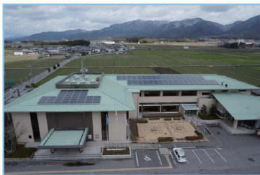
市民共同発電所3号機 滋賀県平和祈念館