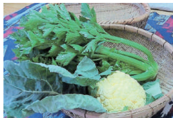
見事に育った野菜