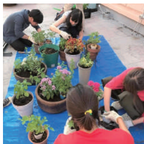
堆肥を利用して花の植え付け