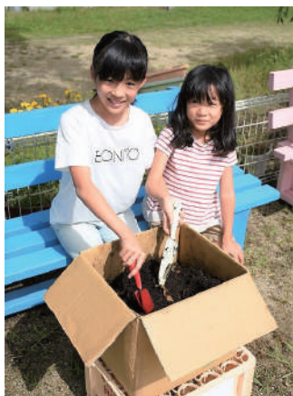
私たちもやっています！