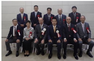
◀「なくそう犯罪」滋賀安全なまちづくり大賞を受賞されたみなさん