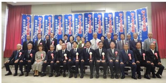
▲滋賀県警察本部長・滋賀県防犯協会長連名感謝状を受けられたみなさん