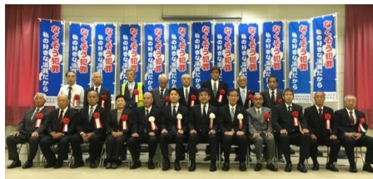
▲全国・近畿防犯功労者（団体）表彰を受賞されたみなさん