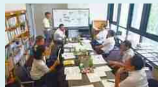
議会だより編集委員会

議会の日程など議会の運営に関することは、議会運営委員会で決定しています。また、特別な事項を専門的に調査するため、特別委員会を設置しています。現在、河川整備推進特別委員会があります。このほか、議会改革検討委員会や議会だより編集委員会、議会報告会運営委員会があります。