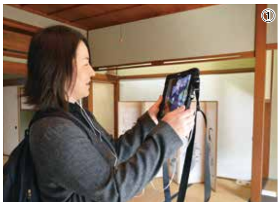
①タブレット 端末を使い近 江商人屋敷を 見学 ②タブレット にはキャラクター が映し出され、 ガイドが行わ れる

実験では、来館者が専 用のタブレット端末をか ざすと、アニメのキャラ クターがガイド役として 映像上に登場し会話や身