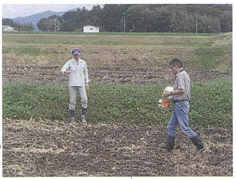
【9月下旬～10月中旬】 *播種(種まき) 菜の花の種は、「ばらまき」で 一反に1Lの種をまきます。