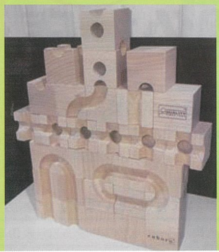
↑藤井棋士も幼少期に使っていた『キュボロ』