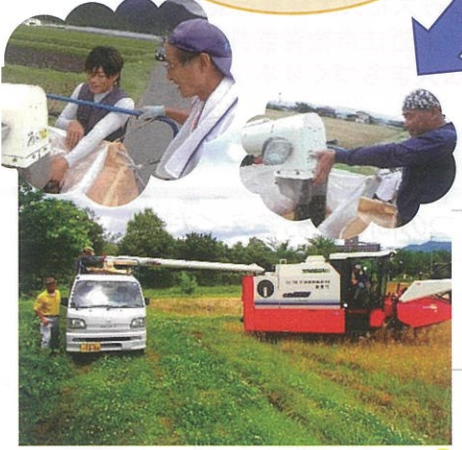
【6月上旬～中旬】 *菜種の刈り取り作業 コンバインは1日に3～4 ha刈 れるとても大きなもの!

周辺で栽培している品種は、 「キザキノナタネ」、「ななしき ぶ」、「きらきら銀河」の3種類 で、 全て食用油用 です。