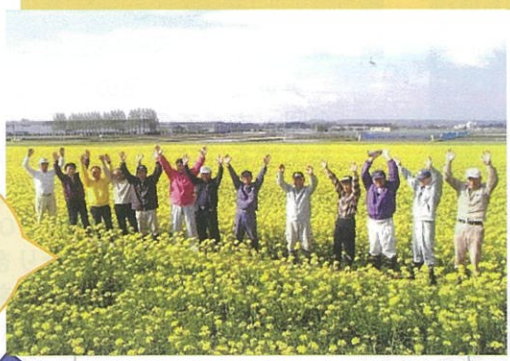
【4月中旬～下旬】 一面黄色い菜の花絨毯に!