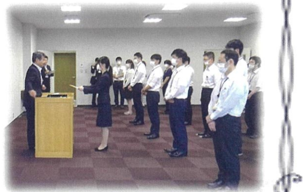
【東近江市地域担当職員任命式の様子】

「蒲生大好き」な公募により選ばれた8名の職員と、支所から2名が配置されました。任期は2年です。みなさんと一緒に汗をかいて頑張ります!