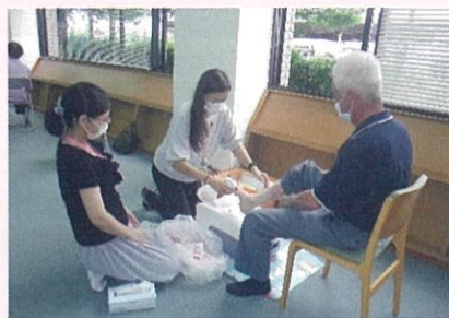
【ふれあい交流部会】