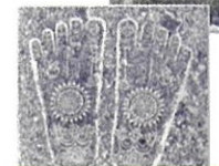
願成寺仏足石拓本