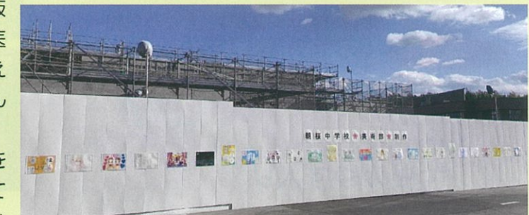
仮囲いに朝桜中学校美術部制作のポスターを展示

また、東近江医療圏域では、がんの診断や治療を地域外の医療施設に頼る割合が他の疾患に比べて高く、患者さんやそのご家族に遠方まで通院していただく必要がありました。今回の診療施設開設で、高度ながん診断と治療が地域の中で行える医療体制となり利便性も高まります。