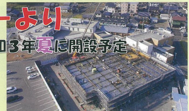
建設中のがん診療施設

蒲生医療センターでは、現在、今夏開設へ向けて最先端のがん診療施設建設工事が進んでいます。