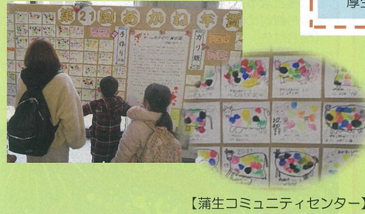
【蒲生コミュニティセンター】

ガリ版をはじめとする手作りの年賀状のおもしろさや温もり、作品に込められた作者の気持ちが感じられる展示となりました。