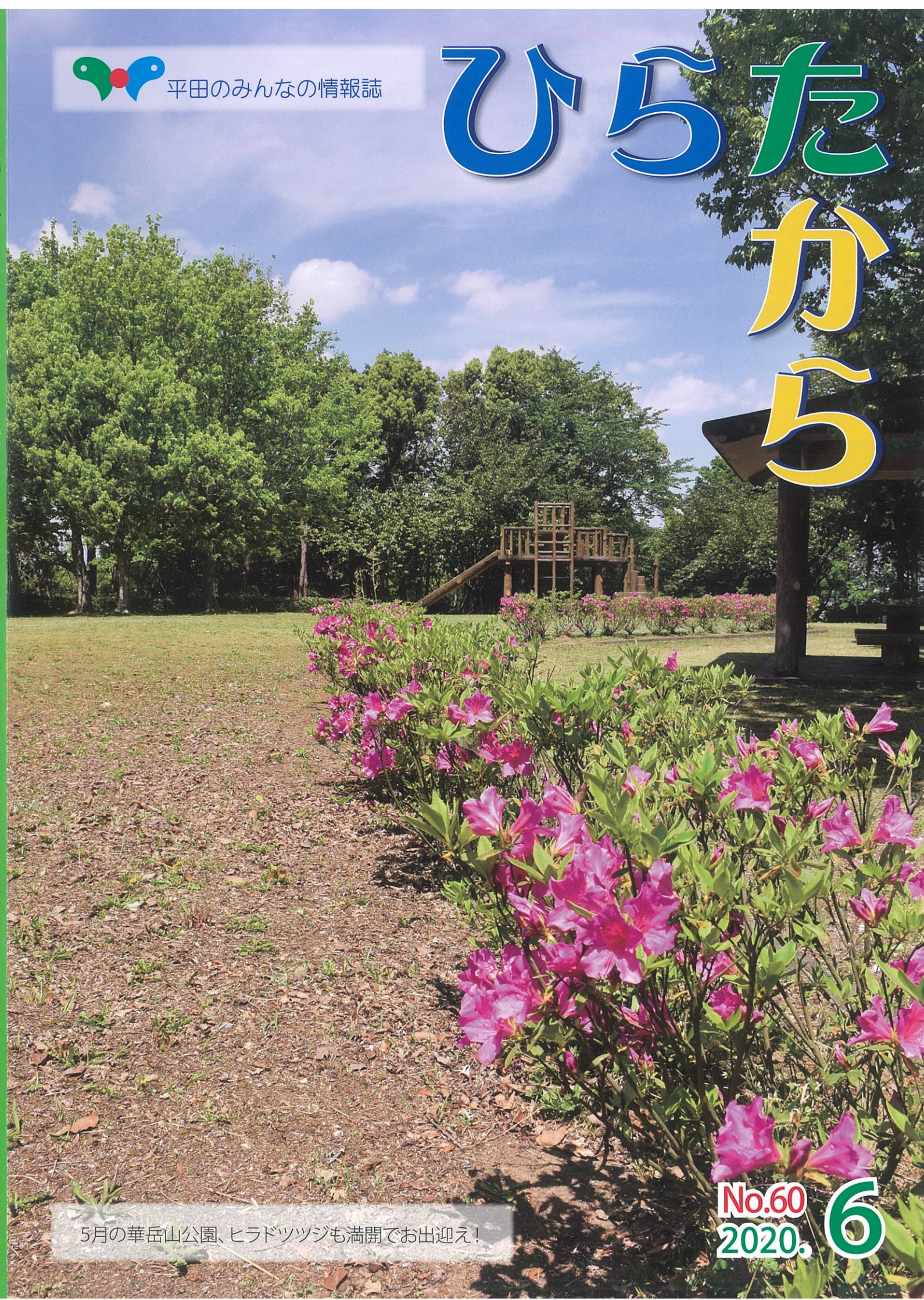
5月の華岳山公園、ヒラドツツジも満開でお出迎え!