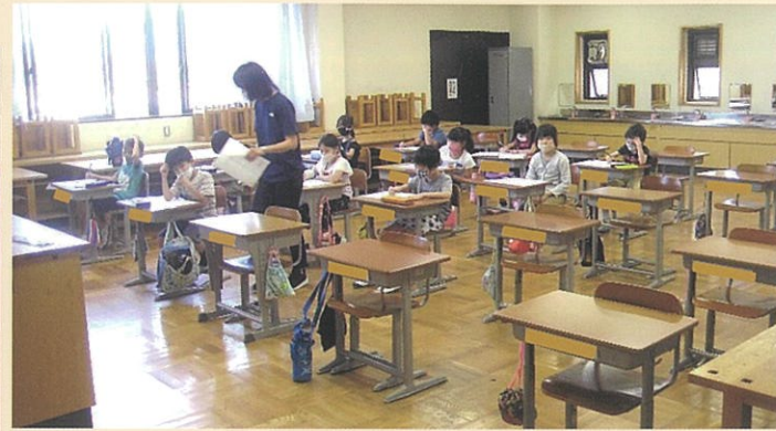
(左) できるだけ机を離して、友だちとの距離をとって。でも学校に来るの「楽しい！」 (上) 算数は2年生以上でクラスを2分割してゆったりと。