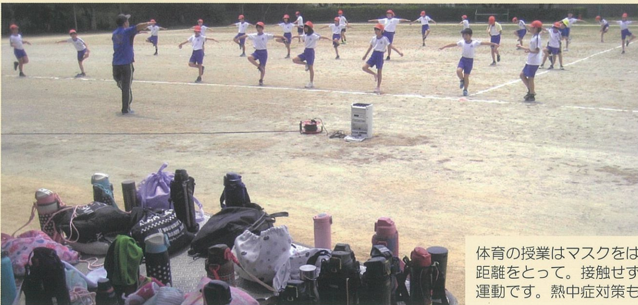
体育の授業はマスクをはずして、距離をとって。接触せずにできる運動です。熱中症対策も忘れずに。