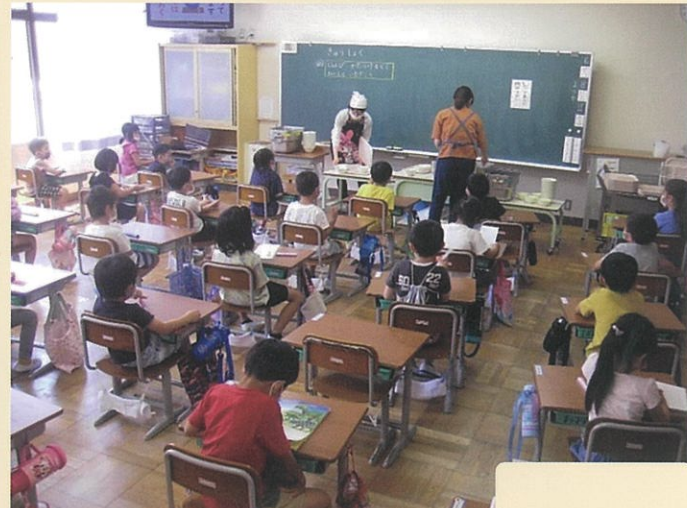
(左上) 6月8日に給食がスタート。「いただきます」を言ってからマスクを外します。 (右上) 1～2年生は先生が机の消毒と配膳を。