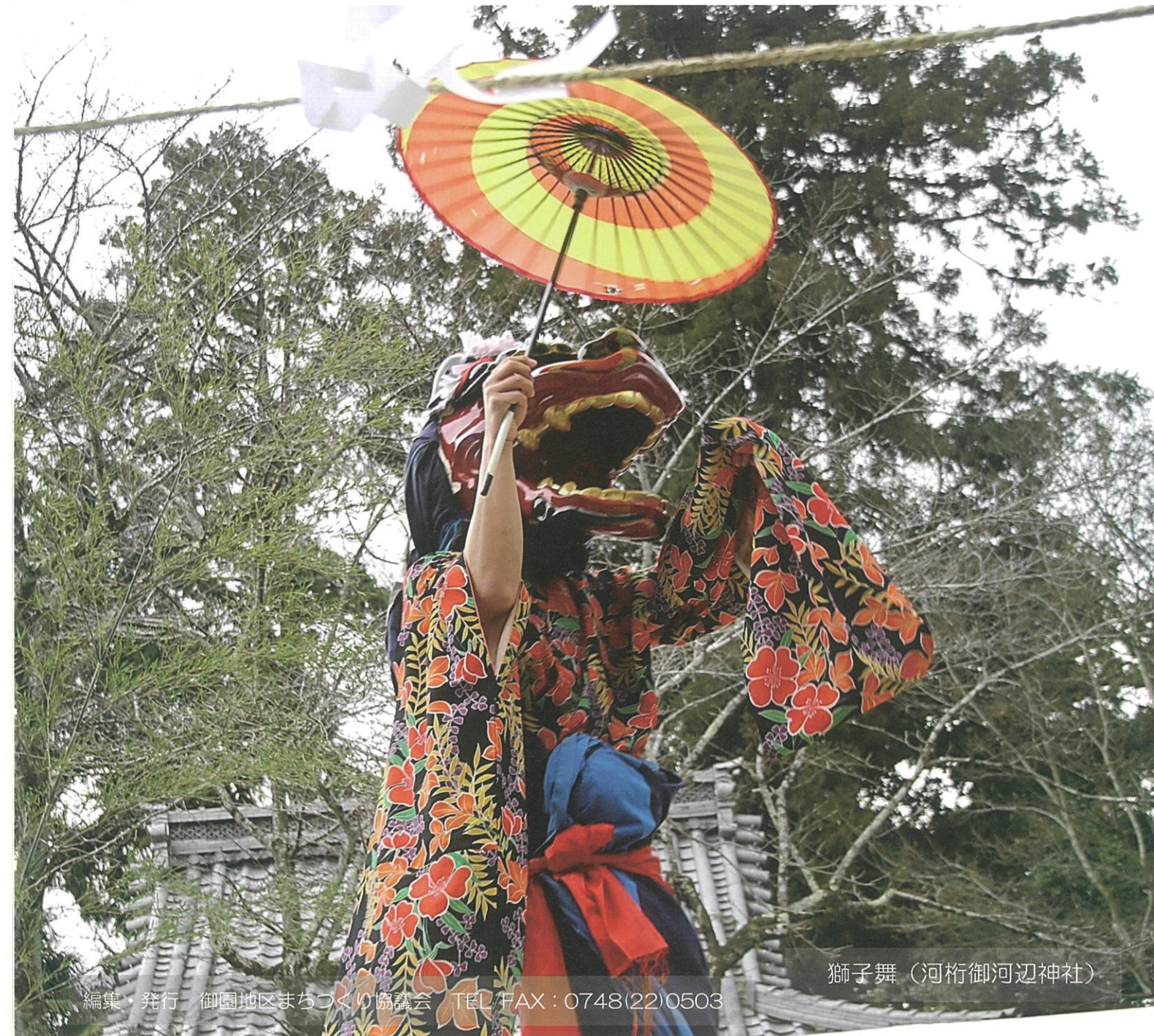
獅子舞 (河桁御河辺神社)