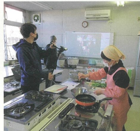
(上) 料理教室撮影中