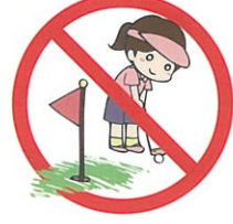
ゴルフクラブは使えません