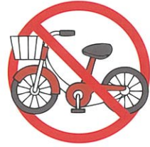
自転車・車は入れません