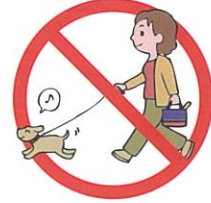
犬等の散歩は出来ません