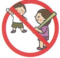
バットは使えません