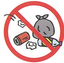
ゴミは持ち帰りましょう