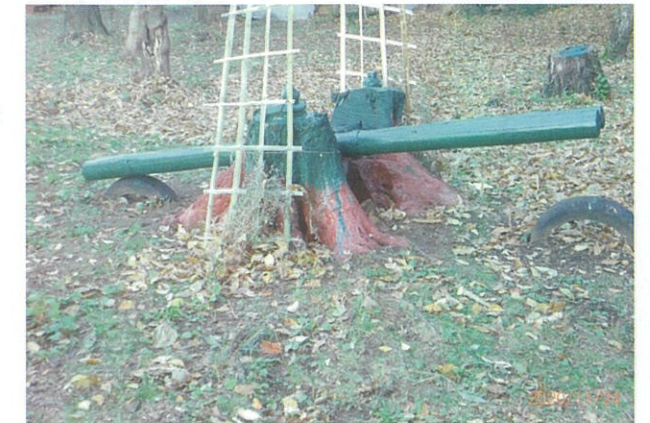
手作りシーソーで遊ぼう!