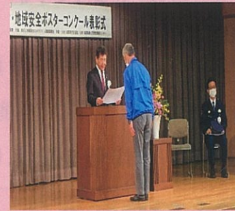
代表の方が表彰を受けられました。

南部地区防犯自治会より、地域安全活動に貢献された団体として、八日市南小学校スクールガードが推薦され、団体表彰を受けられました。スクールガードの皆さんは、学校の登下校時に交差点等で子どもたちの見守りやあいさつの声掛けなど温かい見守り活動をされています。