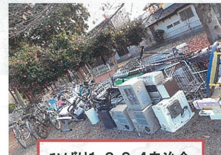
ひばり1・2・3・4自治会

11月28日(土)大型金属資源の回収が各自治会にて行われました。早朝より皆様のご協力ありがとうございました。役員の皆様ご苦労様でした。