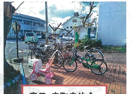
春日・幸町自治会