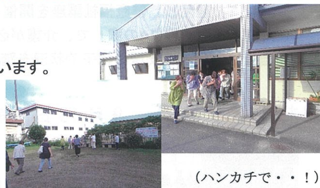
(避難場所をめざして!)

南部コミュニティセンターでは、毎年2回の避難訓練をしています。1回目は年度のはじめに行いますが、今年は、新型コロナウイルス感染防止で、コミセンの使用が少なかったため、時期をずらせて行いました。今回は、「パッチワーク」と「なかよし着付け」のサークルの方に協力していただき、避難経路の確認や通報の練習を行いました。また、避難するときに気をつけること等をお願いをしました。