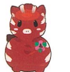
能登川高校 イメージキャラクター「いのち」

平成26年度から定時制課程を開設し、全日制・定時制昼間部・定時制夜間部を揃えた三部制の学校となり、約500名の高校生の姿は、能登川の日常から切り離すことはできません。