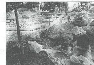
雪野山古墳発掘調査 フルイがけ作業