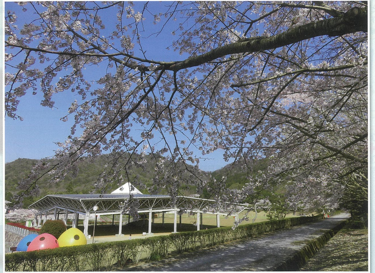
やわらぎの郷公園の春 < 2020.4.4 >