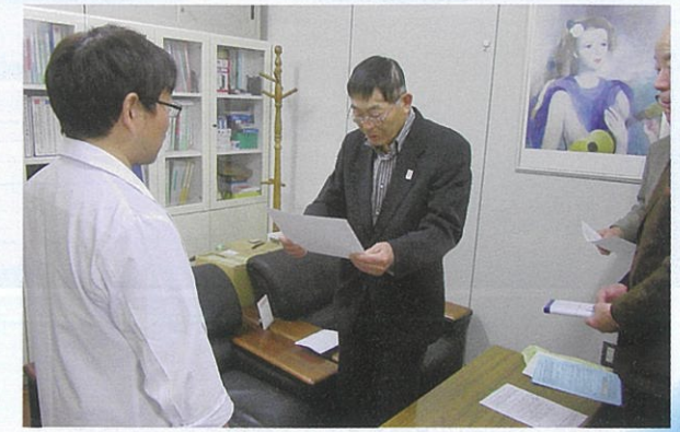
■能登川病院をよくする会

従来の日野と湖東の両記念病院を結ぶ循環バス（予約不要）も、蒲生医療センターを含めた一日3便を設け、利便の向上が図られました。