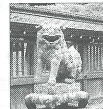
わらう狛犬 (菅原神社) 愛東外町