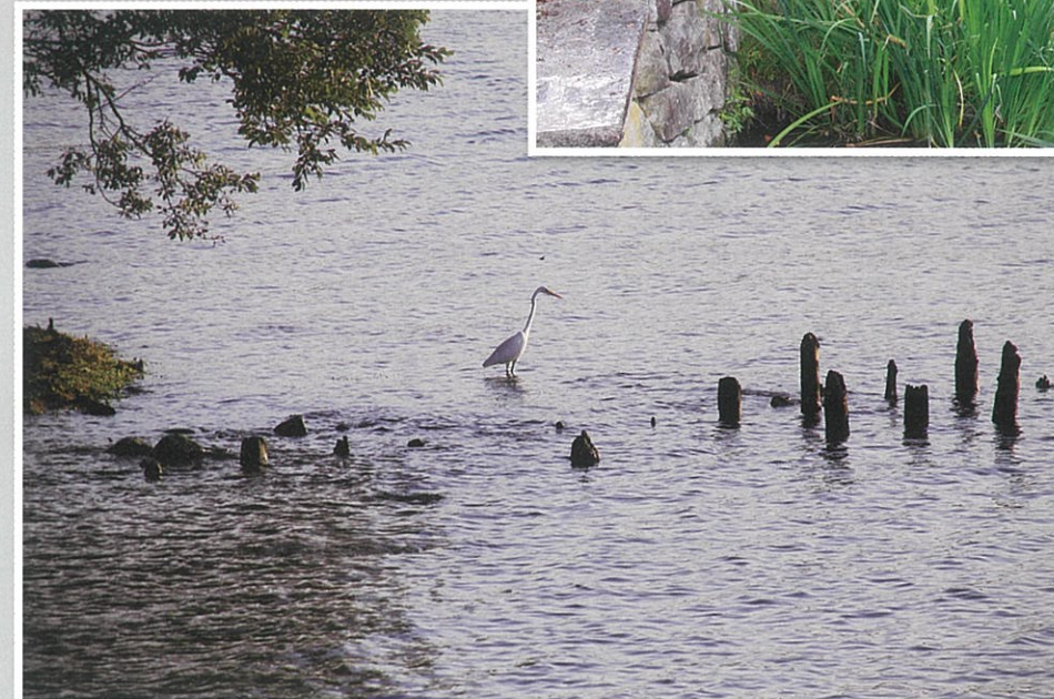
水辺の景観 (伊庭町)