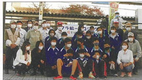
能登川中学校生徒会17名