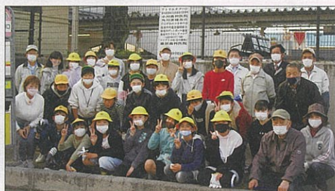
能登川南小学校5・6年生22名