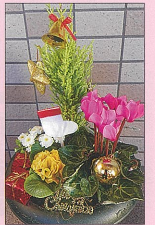
※受講生の皆さんに送っていただいた写真は、能登川コミュニティセンターのフェイスブックに掲載しています