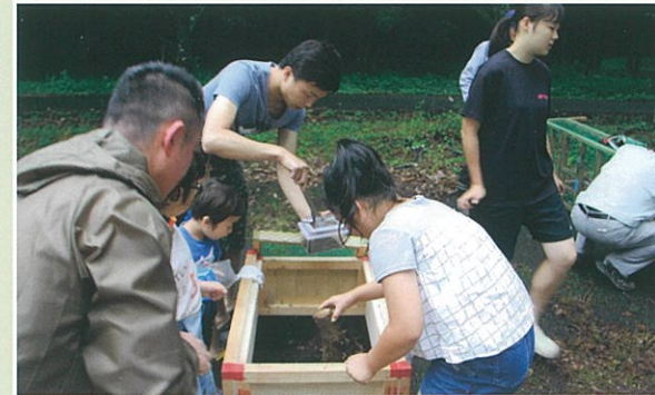
【写真は昨年の様子】

今年の里山ハートフルフェスティバルは新型コロナウイルス感染防止対策のため中止することになりました。