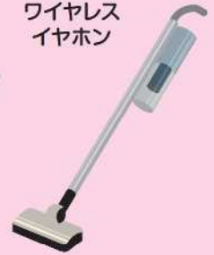
ハンディクリーナー

誤った出し方をするとごみ収集車や清掃センターの火災事故につながります。 ごみの出し方をしっかりと守ってください！！