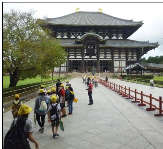
6年修学旅行:大仏殿へ向かっています

「本物」に触れる体験や教室ではできない体験に、子どもたちは目を輝かせて取り組みました。この体験は豊かな学びになるだけでなく、子どもたちの心に残る良い思い出にもなりました。保護者の皆様には準備等、大変お世話になり、ありがとうございます。