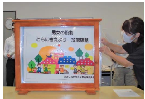
▲ 出前講座の大型紙芝居

主な活動としては、毎月の定例会議や地域への出前講座などを実施しています。また、男女共同参画に関する講座や研修に参加するなど、自己研さんに努めています。