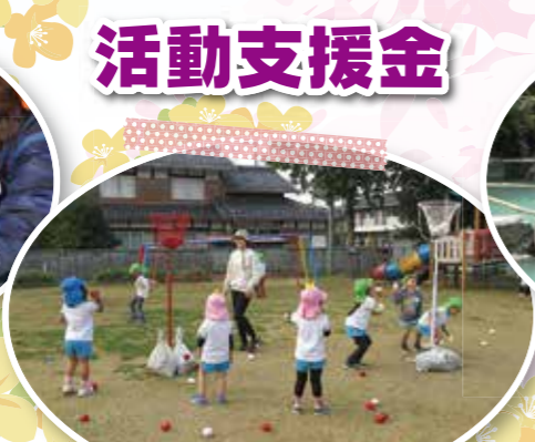
あさひ幼児園(紅白玉入れ台購入)