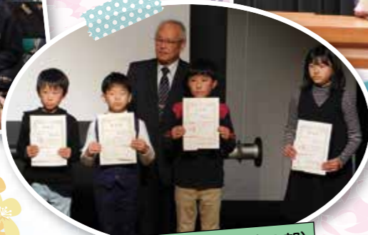
標語表彰者(小学生の部)