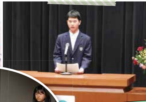
作文発表(中学生の部)