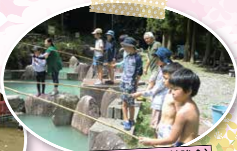
コミセン事業(夏休み勉強会)