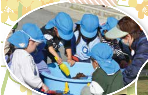
花いっぱい運動 あじさい幼児園