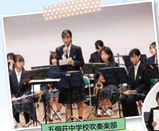
五個荘中学校吹奏楽部