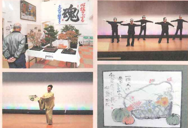
ステージ発表や作品展示を行い、日頃のサークル活動の成果を発表しました。