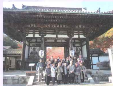
今年は大津の石山寺を訪れました。きれいな紅葉を楽しみながら、サークル相互の交流ができました。