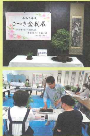
盆栽や書道、絵手紙の作品展示や苔玉づくりの体験教室を開催しました。