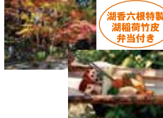
湖香六根特製 湖稻荷竹皮 弁当付き