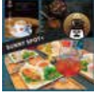
▲セットメニュー 季節により多少メニュー に変更が生じます。

内容 透き通った空気を味わいながら、朝のお散歩登山を体験し、静寂の絶景広がる瓦屋禅寺で、座禅体験を1時間実施します。自分との会話やリフレッシュ、心静まる時間を体験。下山後、駅近カフェSunny Spot+でモーニングと座談会を開催します。行ってみたいところや感想etc...共有体験した時間を分かち合います!!