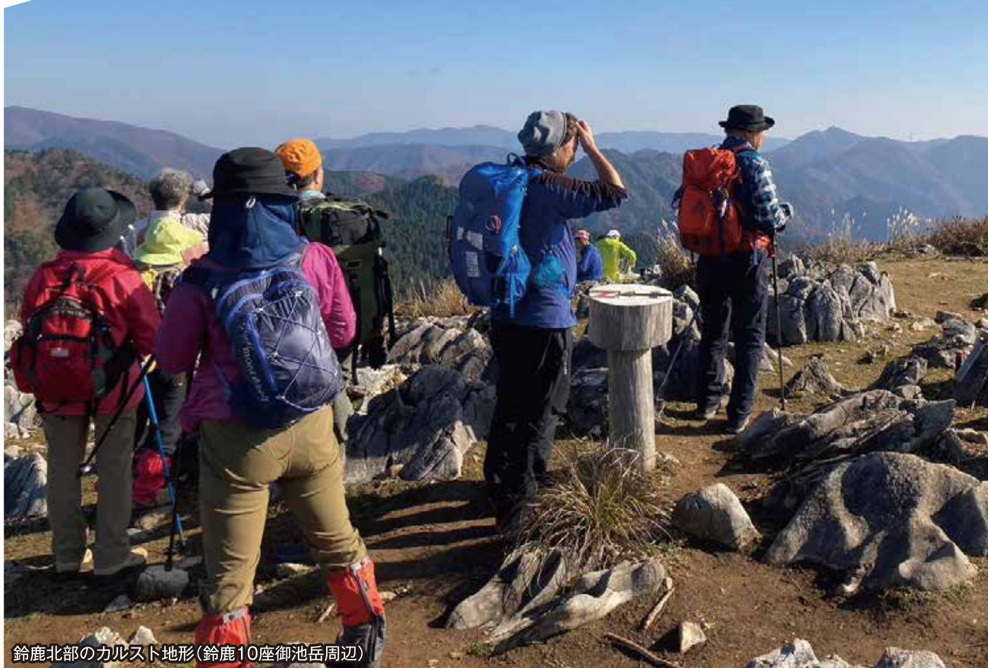
鈴鹿北部のカルスト地形(鈴鹿10座御池岳周辺)