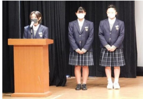
五個荘中学校生徒会の皆さんによる司会進行