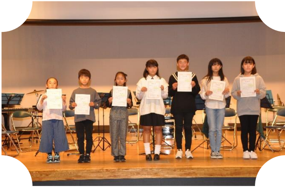
五個荘小学生表彰者