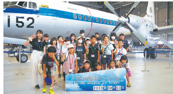
大空を飛んだ実機に触れ、大きさを体感!!

■行き先：あいち航空ミュージアム 明治なるほどファクトリー ■参加者：小学生23人・保護者8人