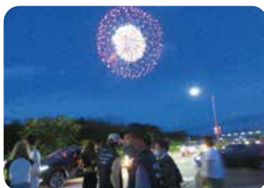
②愛知川祇園祭りパトロール