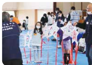
③「わくわく広場」凧づくり