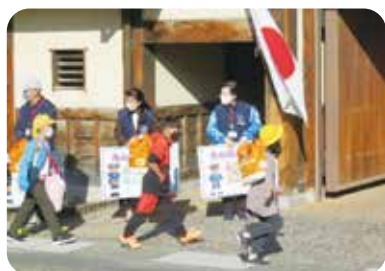
①小学校見守り活動

パトロール時には、少しでも子どもの環境づくりに役立てればと思い、ゴミ拾いを実施しています。