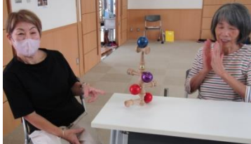
けん玉を使ってバランス感覚を養う