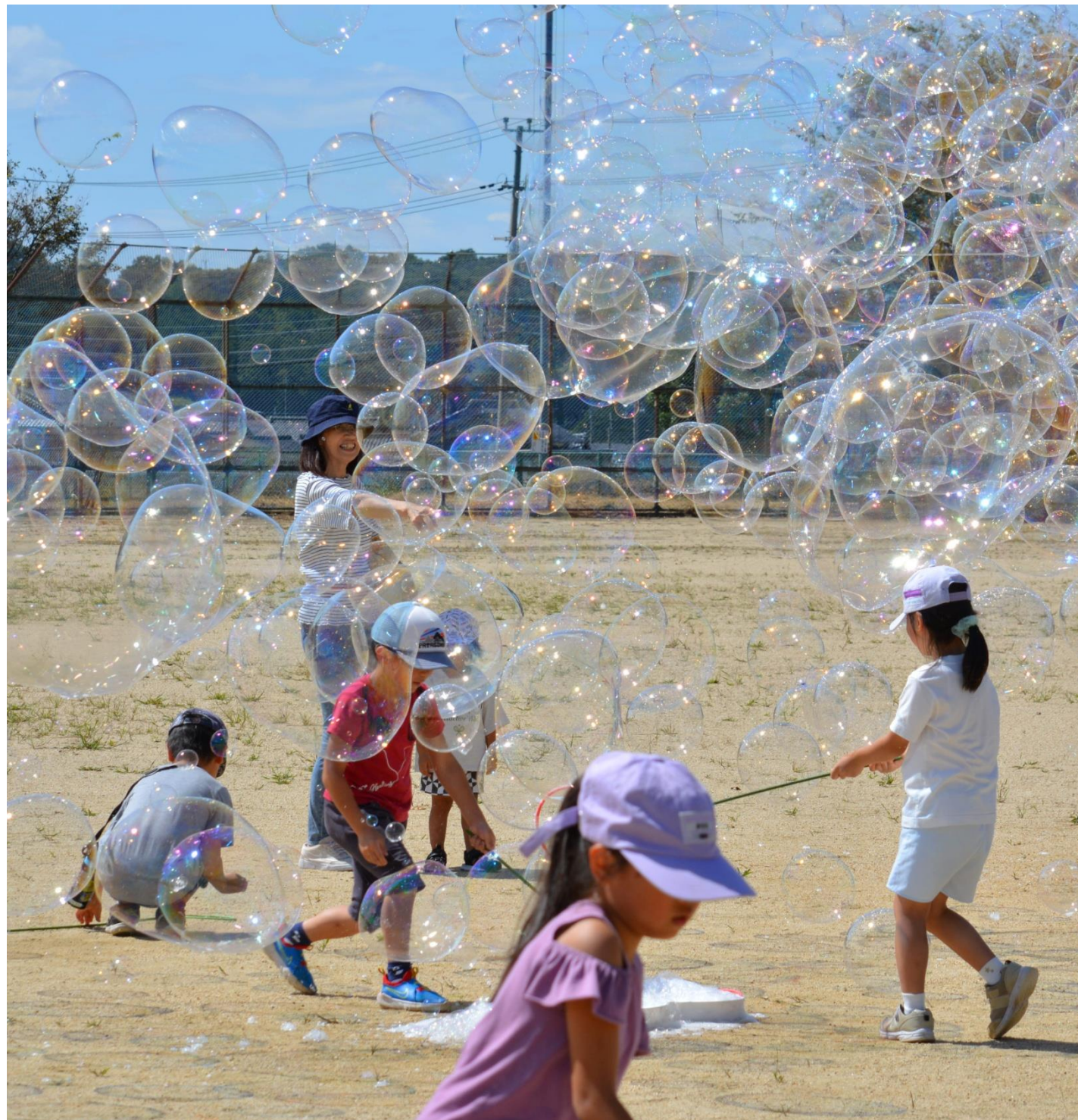
シャボン玉、飛ばそ!! 9月24日 永源寺スポーツフェスタ