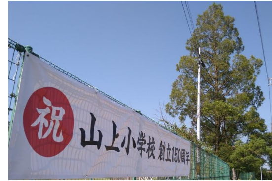
「山上小学校創立 150 周年」の横断幕を設置