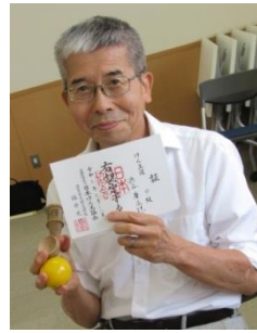
認定証を手にする参加者

参加者は、懐かしいけん玉を手で、身体を中心に構えた後、正しい持ち方や膝の屈伸を使い