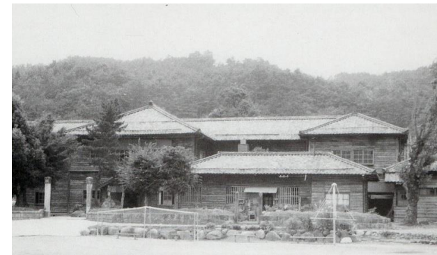
明治 39 年に現在の地に建てられた校舎