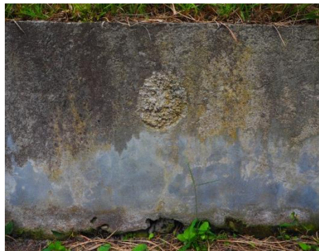
セメントで隠した弾丸跡（石谷町）

戦争の罪悪と戦争が残した悲惨さ、そして「戦争は絶対にやってはいけない」ということを若い世代の方々に語り継いでいきたいと思っています。