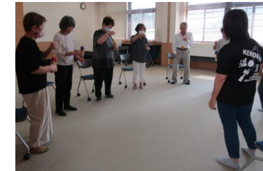
級や段に合わせた技に挑戦