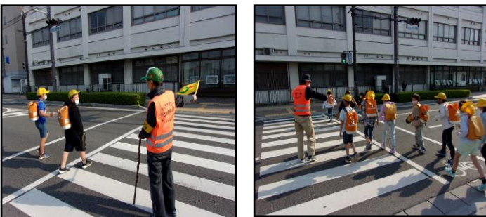
登下校の見守り ありがとうございます