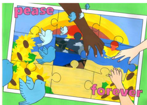
2020 ポスター部門最優秀作品 (中学生の部)