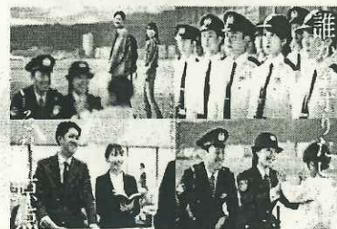
滋賀県警察官募集