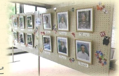
令和2年度掲額の様子