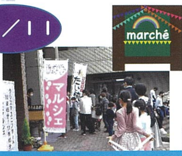
大盛況のぐるっぺマルシェ