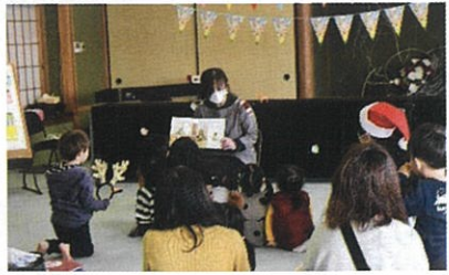
不思議なクリスマスのおはなし。絵本にじーっと見入ります。