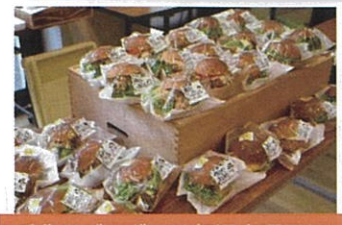
いつも大人気の Taiyou.Breads.さんのパン