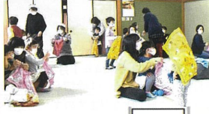
パンダナでいろいろ布あそび！