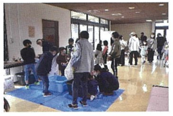
子どもマルシェ也大賑わい

愛東コミュニティセンターで開催しました「ぐるっぺマルシェ」には、たくさんの方にお越しいただきありがとうございました。 愛東地区まちづくり協議会では今後も皆さんに楽しい時間を過ごしていただけるマルシェを企画していきます。❤️写真で様子をご覧ください！