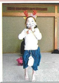
バスタオルでかわいいトナカイに変身！