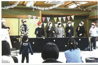
「きらきら星」「きよしこの夜」…ハンドベルの澄んだ響きにみんな聞き入りました。

今回のスペシャルおはなし会もすてきな内容が盛りだくさん！24名の親子が楽しいひとときを過ごされました。