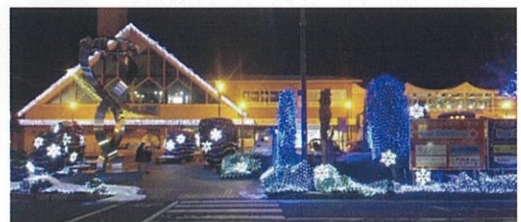
蒲生地区まちづくり協議会(広報企画委員会)

防寒対策バッチリでゆっくり往復約30分。屋間の慌ただしさを忘れ、しばし繰り広げられる光のページェントを堪能できる。2月18日まで。