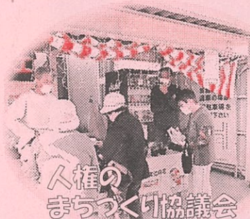
人権の まちづくり協議会