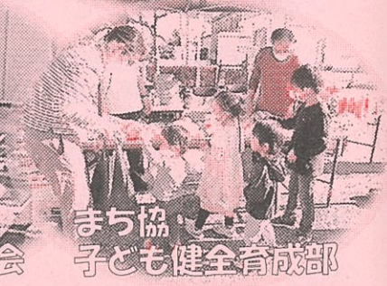
まち協 子ども健全育成部