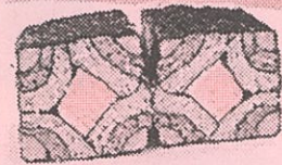
きれいな模様の 四角巻き