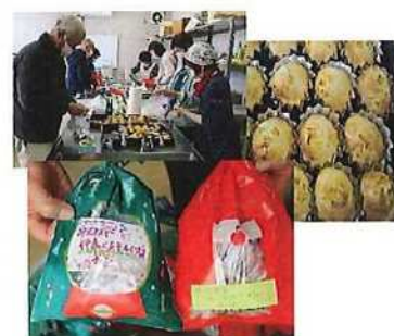
美味しく食べてくれたかな