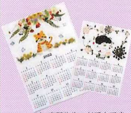
↑ 安藤先生のお手本です