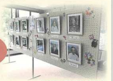
令和2年度掲額の様子 ※写真展の会場は、あらかじめお知らせいたします。