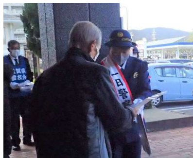
▲西友八日市店での啓発活動の様子

出動式終了後には、西友八日市店で街頭啓発を行い、来店者に犯罪や交通事故防止を呼びかけました。