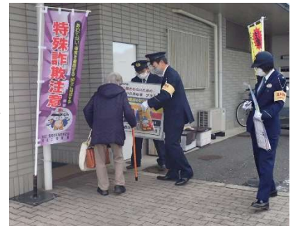
▲ 滋賀銀行での啓発活動の様子