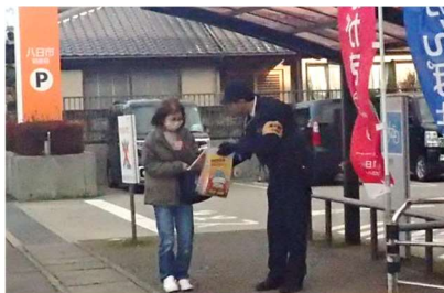
◀ 郵便局での啓発活動の様子

東近江警察署は、年金支給日の令和4年12月15日(木)に滋賀銀行八日市東支店と八日市郵便局で特殊詐欺被害防止の啓発活動を行いました。啓発活動には、当防犯自治会も参加し、「特殊詐欺が多発しています。被害にあわないよう注意してください。」などと声をかけ被害防止を呼びかけました。