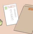
●はがき・封筒(※) (圧着はがきは不可)