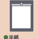
●半紙 (墨のついていないもの)