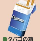
●タバコの箱 (銀紙ははずす)