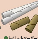
●トイレットペーパーや ラップの芯