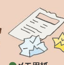
●メモ用紙 (のり付は不可)