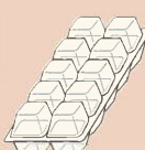
●紙製たまごパック