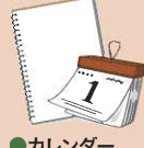
●カレンダー ●スケッチブック(※)