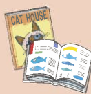
●パンフレット ●カタログ