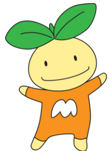
東近江市こども施策 PR キャラクター こども未来ちゃん