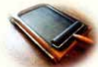
【蒲生地区まちづくり協議会】