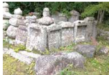
石塔寺の石仏(入口付近)

山門前から山上に登る石段の左側に並ぶ石仏・石塔群の中にも、弘法大師の石仏が見られる。