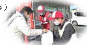
【蒲生赤十字奉仕団】