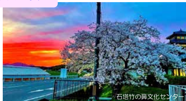
石塔竹の鼻文化センター