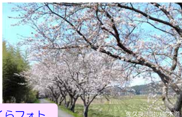
佐久良川沿い並木道