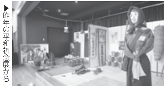
▶ 昨年の平和祈念展から

『陸軍八日市飛行場と兵士たち』をテーマに、陸軍八日市飛行場を中心とした当時の東近江地域の状況、若くして犠牲になられた兵士をクローズアップします。