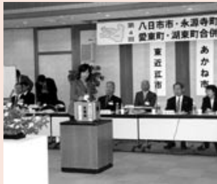
▲最終投票の結果「東近江市」に決定