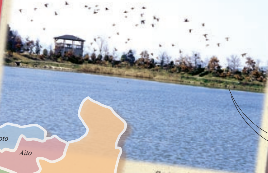
冬の訪問者（八日市市 春先の湖邊）