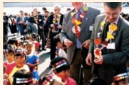
▲湖東町とレトビック市との交流

八日市市 滋賀県伊吹町、大阪府柏原市 永源寺町 岡山県勝山町 愛東町 北海道愛別町、神奈川県愛川町、長崎県愛野町