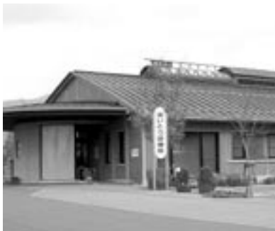
▲愛東町 国民健康保険あいとう診療所